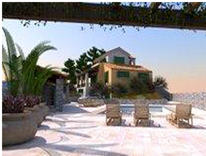
Sonnterrasse mit Pool